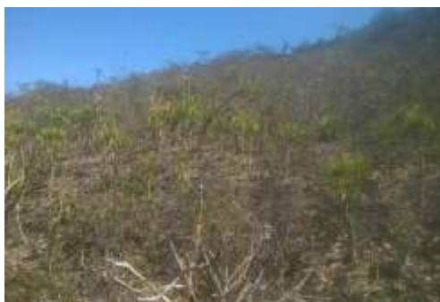
Foto 09: Vegetação a ser suprimida Área de Campo Rupestre Ferruginoso.