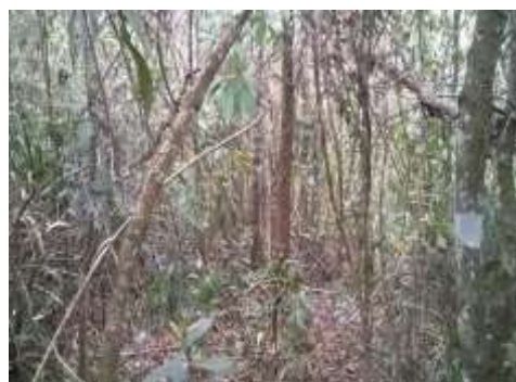
Foto 10: Vegetação a ser suprimida Floresta Estacional Semidecidual - Médio