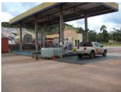
Foto 03: Pátio de abastecimento de veículos pequenos